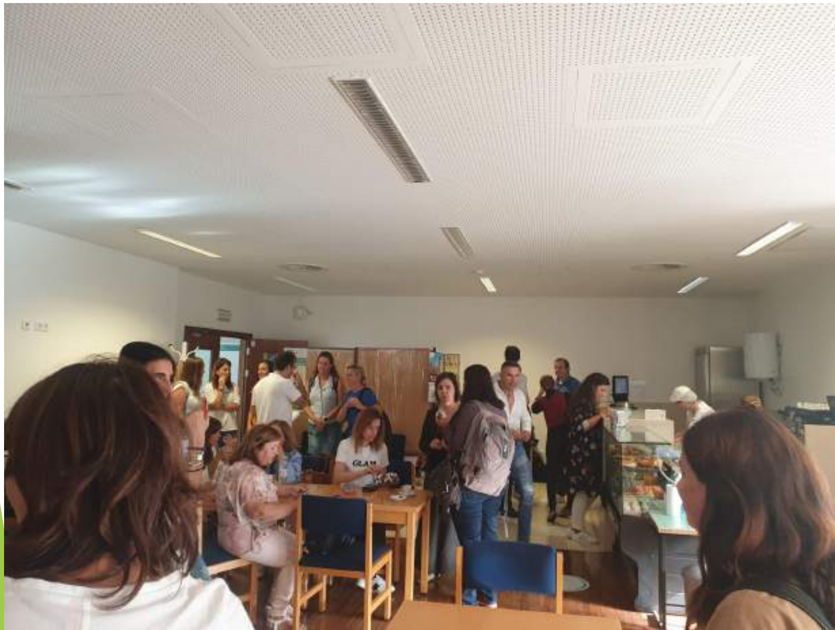
IL BAR riservato ai docenti