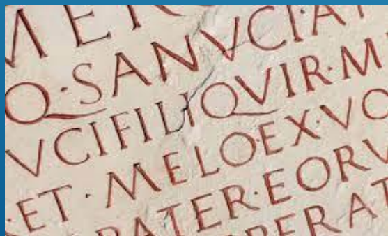
Corso di latino

Digital Board e coding in tutte le classi