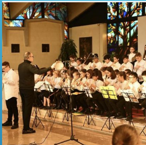
Coro e orchestra di flauti barocca