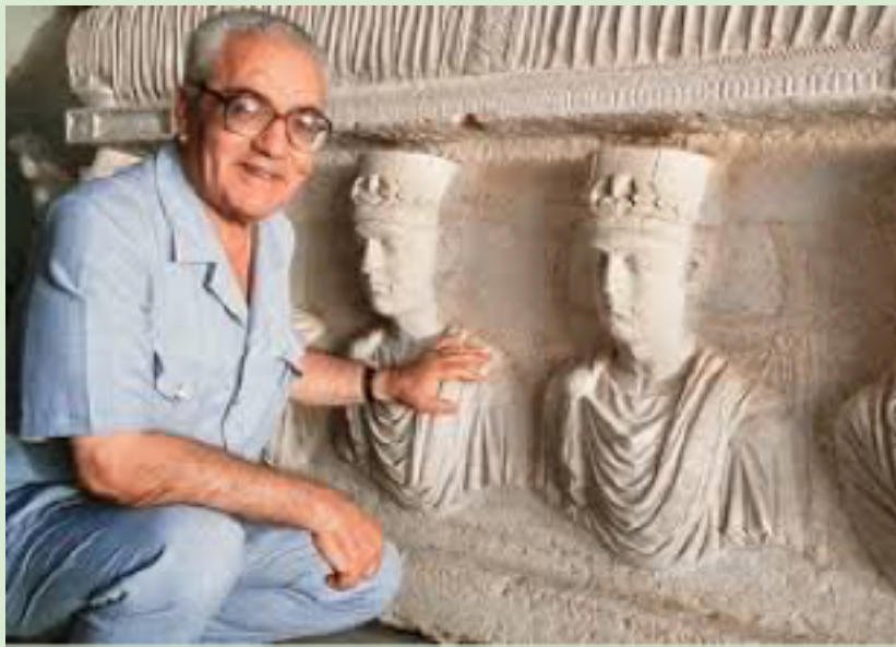
KHALED AL-ASAAD , custode di Palmira trucidato dall'Isis nel 2015