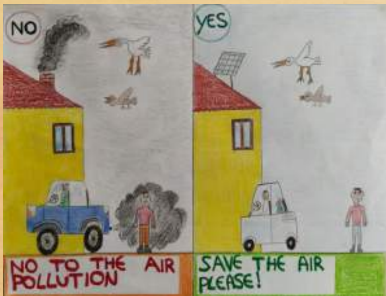
SCEGLIAMO LA MOBILITA' SOSTENIBILE