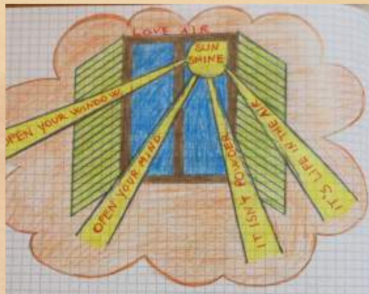
SCEGLIAMO LA LUCE DEL SOLE