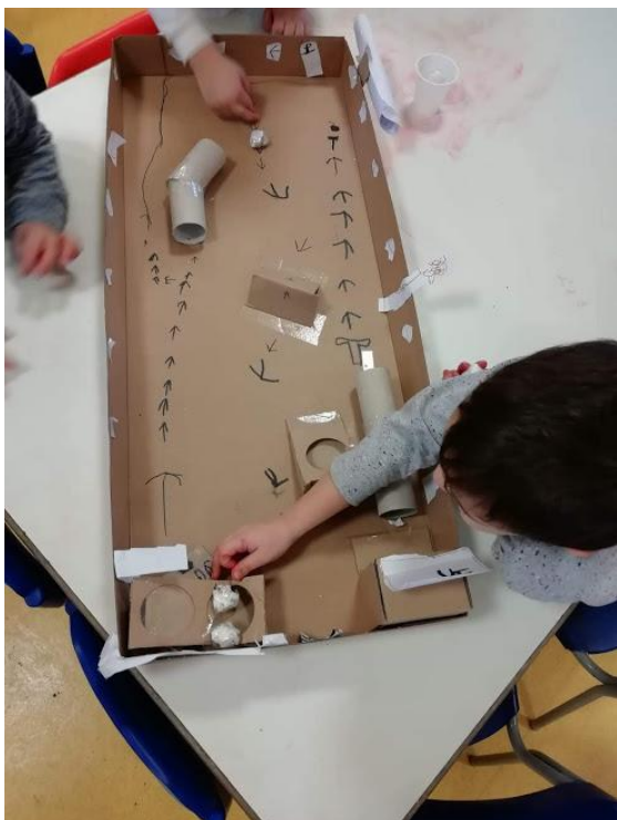
Il percorso delle palline