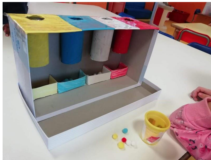
Indovina il colore

I bambini hanno imparato ad utilizzare materiale di riciclo per costruire dei giochi da utilizzare in classe.