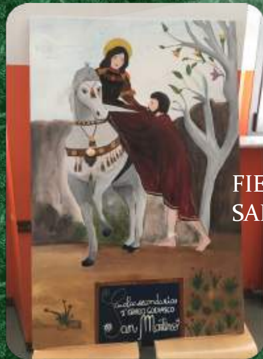
FIERA DI SAN MARTINO