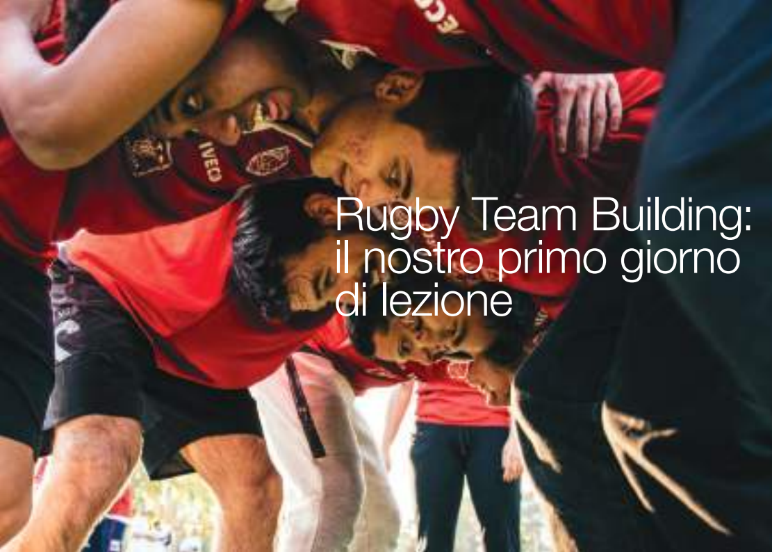
Rugby Team Building: il nostro primo giorno di lezione