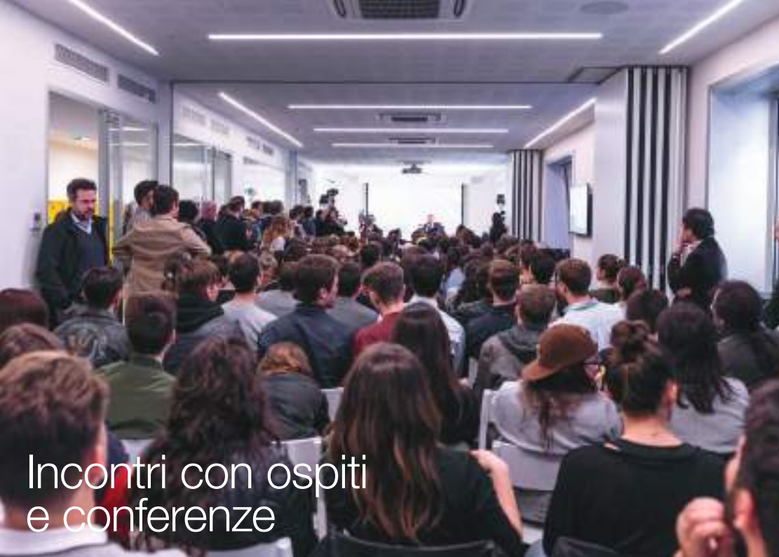
Incontri con ospiti e conferenze