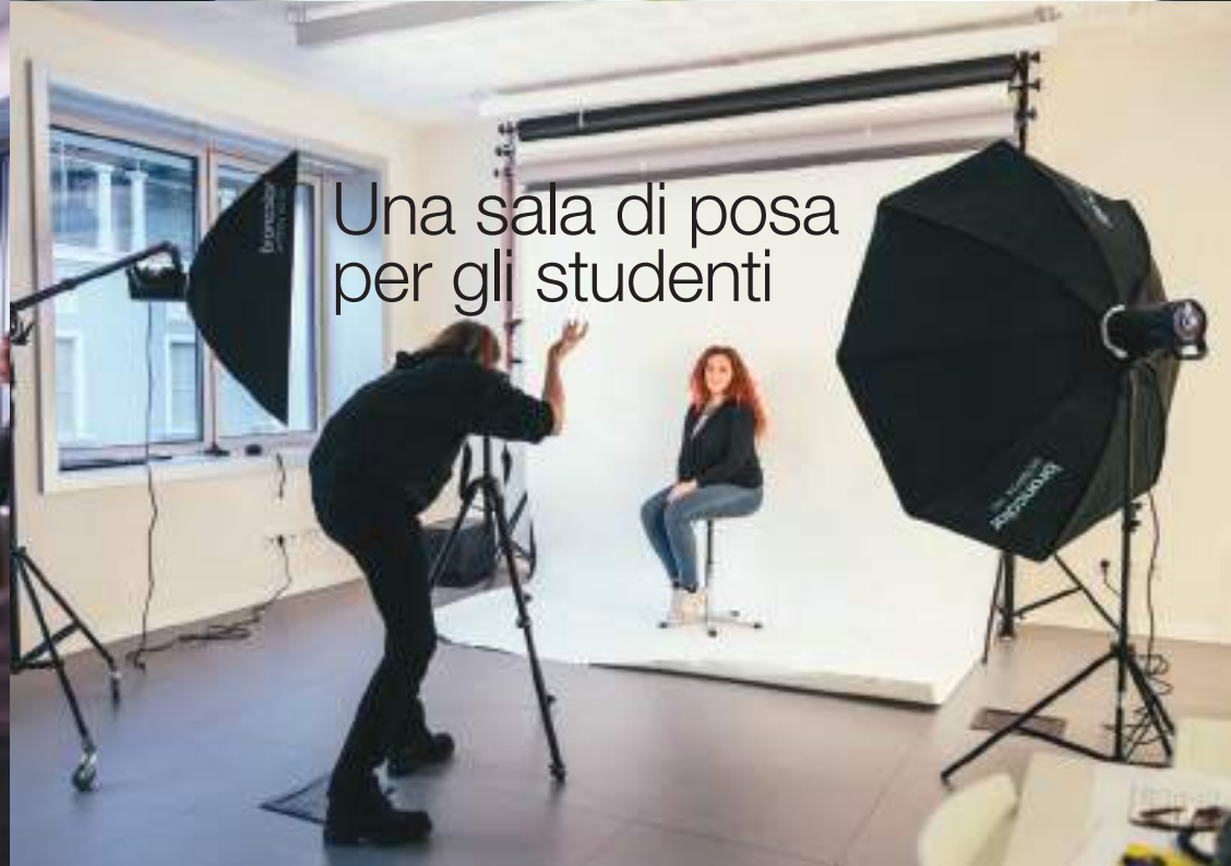
Una sala di posa per gli studenti