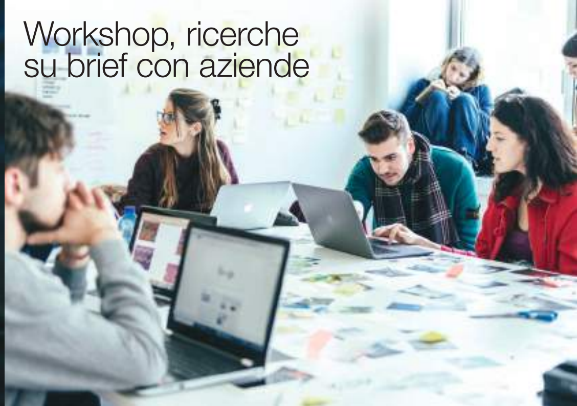
Workshop, ricerche su brief con aziende