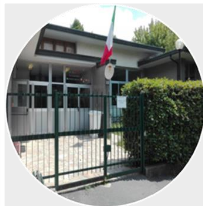
Secondaria 1° Quarenghi14